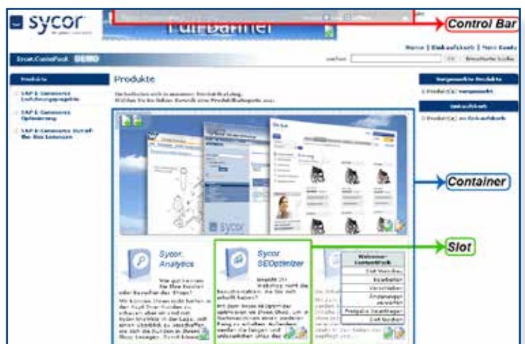
Der Aufbau des Sycor.ContentPacks