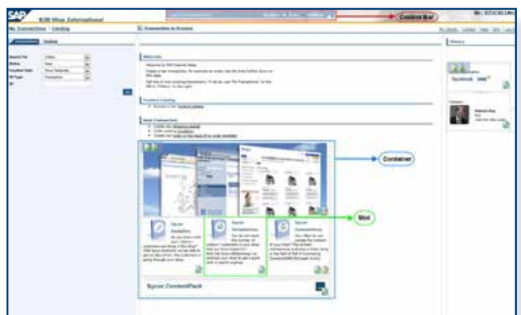
Der Aufbau des Sycor.ContentPacks